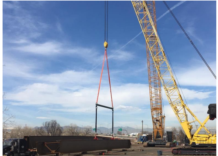
Se preparan a colocar las vigas del Puente elevado de la I-270