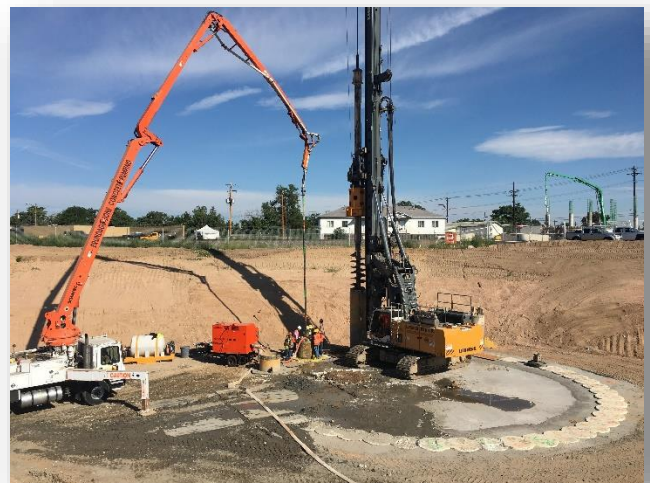
Estación de bombeo cerca de la Calle York

Las actividades de construcción dependen del clima y de las condiciones del sitio, y los horarios están sujetos a cambios.