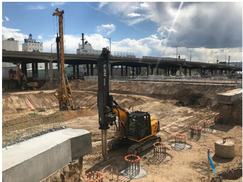
Construcción del puente de la Calle Monroe

Las actividades de construcción dependen del clima y de las condiciones del sitio, y los horarios están sujetos a cambios.