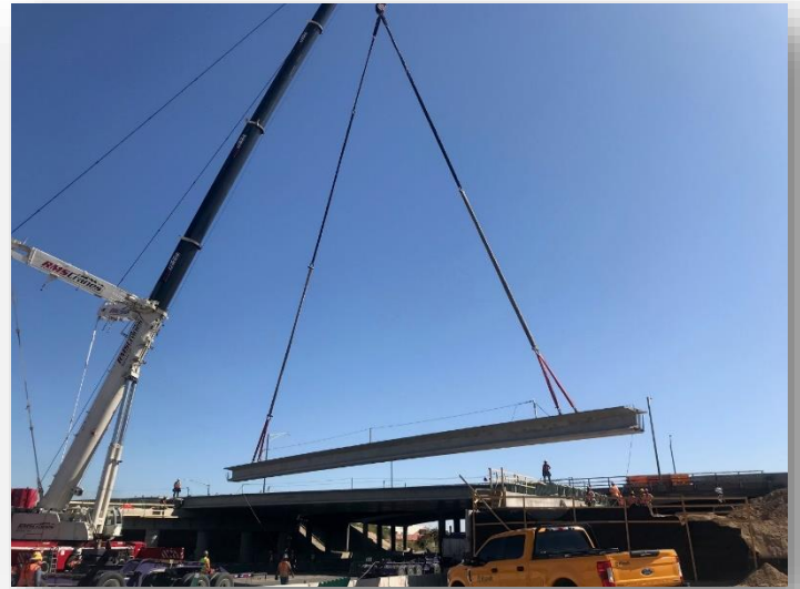
Viga colocada en el puente del Bulevar Colorado

Las actividades de construcción dependen del clima y de las condiciones del sitio, y los horarios están sujetos a cambios.