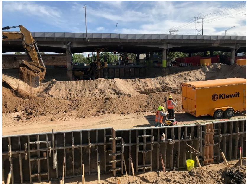
Mirando hacia el sur, los soportes del puente de la Calle Columbine que quedará encima