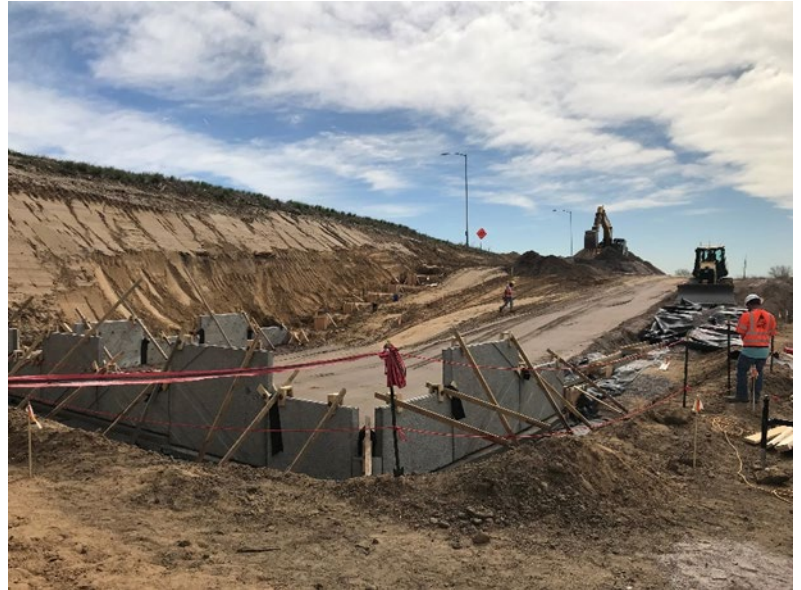
Construcción del soporte del puente elevado de la I-270